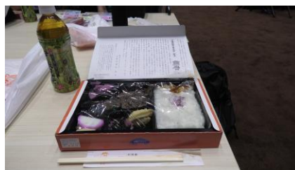
元祖特撰牛肉弁当