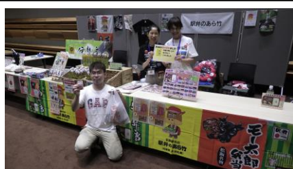
駅弁のあら竹ブースにて