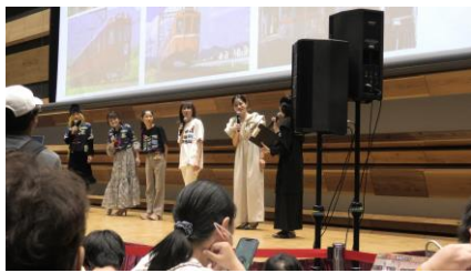
トークショー(あなたは何鉄?)

2日間にわたって開催された大和鉄道まつり 2025 のステージ上では さまざまな催しが開催されていました。