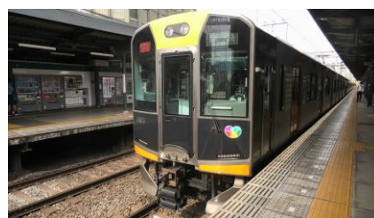
阪神 1000系 快速急行