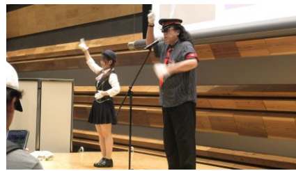
SUPER BELL”Z ミニコンサート