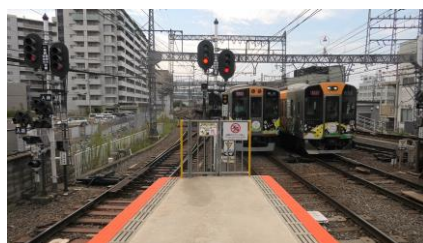
快速急行 近鉄奈良行き