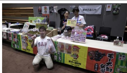
初日は 11:30 には完売！！

昼食は2日間とも駅弁のあら竹の口福弁当をいただきました。 早朝より大和鉄道まつり 2025 のために準備いただき、 本当にありがとうございます。