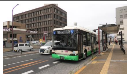
奈良市庁前バス停