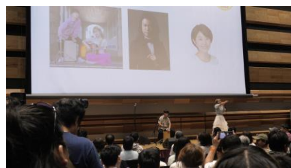
半熟 BLOOD ミニコンサート