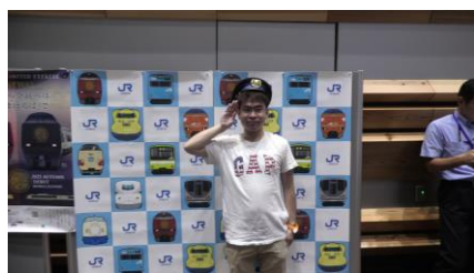
JR 西日本ブースにて