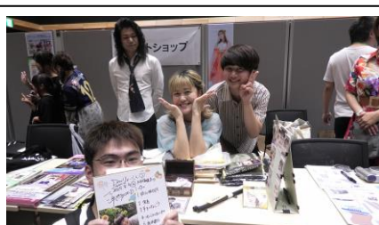
半熟 BLOOD・中将タカノリさん