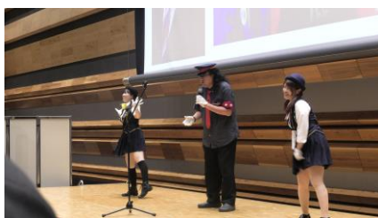
SUPER BELL”Z ミニコンサート