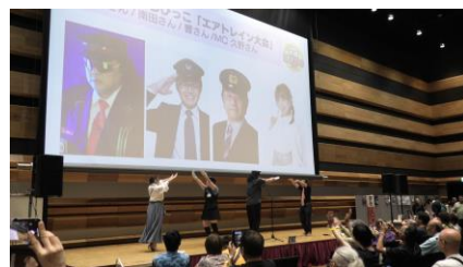
ちびっこ「エアトレイン大会」