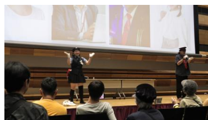
SUPER BELL”Z ミニコンサート