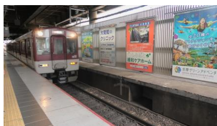
近鉄 5800系 快速急行

鶴橋駅からは近鉄奈良線の快速急行に乗車しました。 会場の最寄り駅は新大宮駅ですが、初日はとある目的のために1駅手前の大和西大寺駅で 降ります。