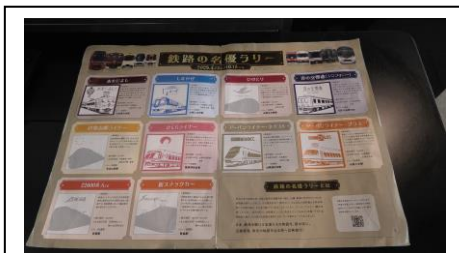
鉄路の名優ラリー 台紙

大和鉄道まつり 2025 が開催されていた 2025.8 には 近鉄で「鉄路の名優ラリー」が開催されていました。大和西大寺駅でラリーの カードがいただけるということで、下車しました。