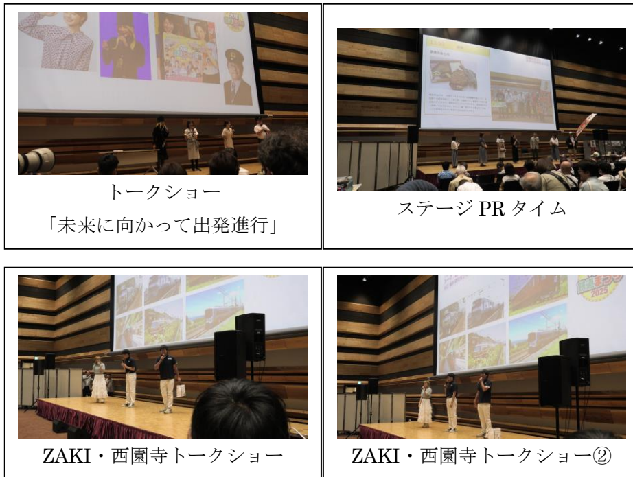
トークショー 「未来に向かって出発進行」