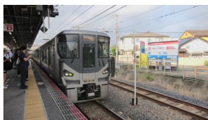
紀州路快速 京橋行き

自宅の最寄り駅から天王寺駅まで紀州路快速に乗車し、 天王寺駅から323系で鶴橋駅まで移動しました。